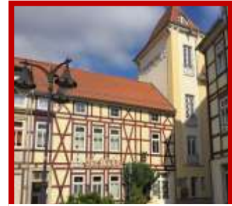
Tormühle Ellrich Raum für Reflexion

Ich kann nur gut sein Wenn ich mich selbst gut fühle!