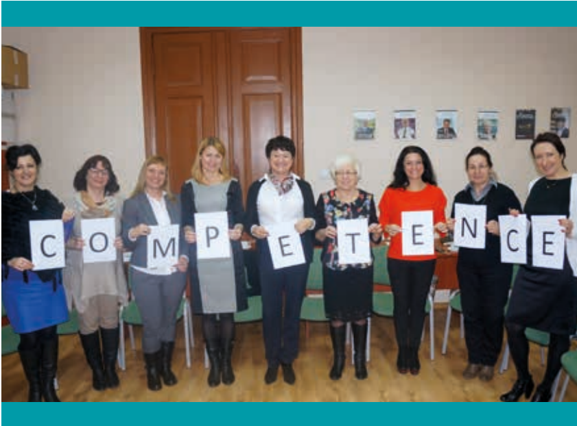
Die polnischen Teilnehmerinnen am „Competence“ Coaching.